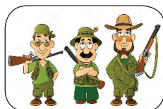
Les chasseurs ●