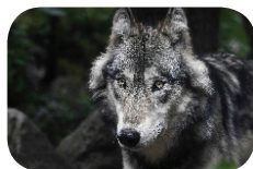
Le loup ●