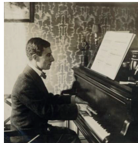
Maurice Ravel